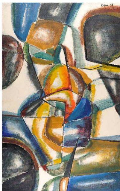
Ladislav Kijno, « Les galets », 1958 Acrylique sur toile, 130x97 cm