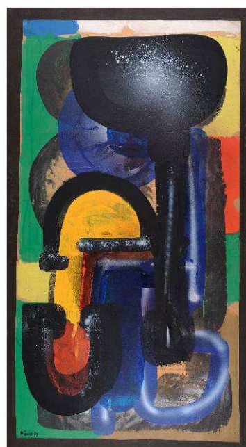
Ladislav Kijno, « Hommage aux Lettres françaises », 1973 Acrylique sur toile, 130x97 cm