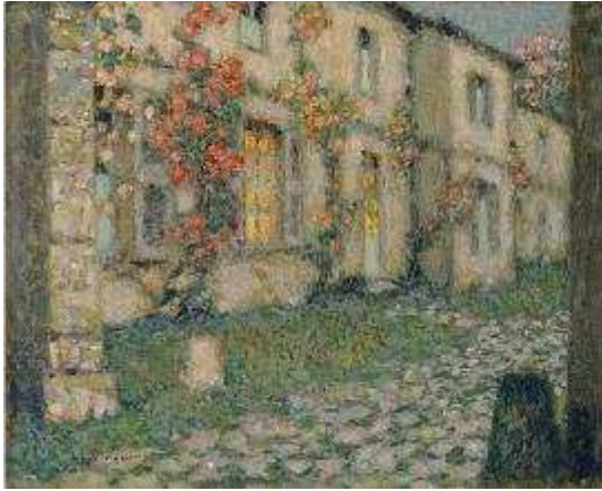
Henri Le Sidaner, Maison aux roses