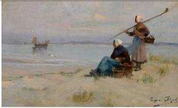
Eugène Chigot, Femmes de pêcheurs scrutant l'horizon , 1894

Collection Musée du Touquet-Paris-Plage