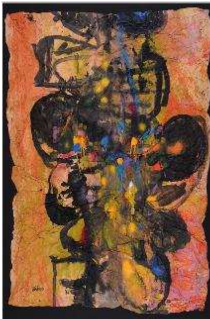
Ladislav Kijno, Retour de Tahiti , 1990

Collection particulière en dépôt au Musée du Touquet-Paris-Plage