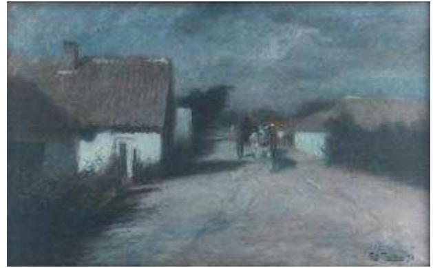
Frits Thaulow, Camiers, la nuit, 1892 © Yannick Cadart, CD62 - Collection du Département du Pas-de-Calais