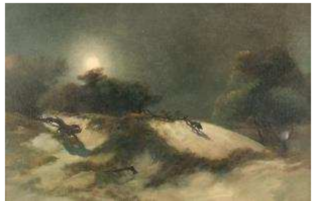
Jan Lavezzari, Dunes mystérieuses au clair de lune , Collection Musée municipal de Berck-sur-Mer, legs Germaine Lavezzari