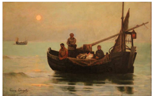
Eugène Chigot, Retour de pêche