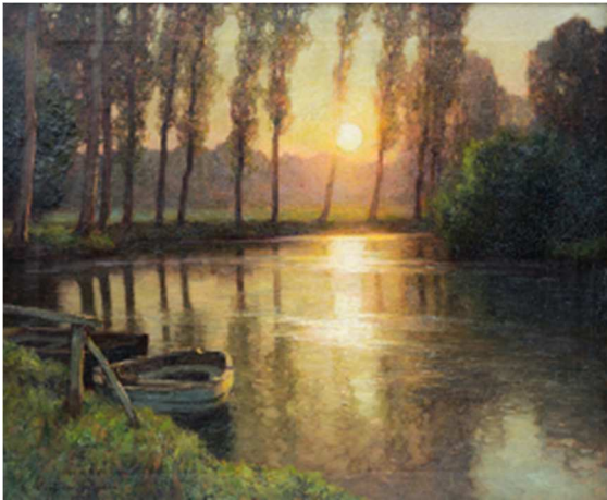
Harry Van der Weyden, L'heure dorée, 1907 © Jean-Michel Graillot – Musée de France Roger Rodière de Montreuil-sur-Mer