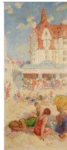
Francis Edwin HODGES, Bar de la plage et le Grand Hôtel , 1929

Collection Musée du Touquet-Paris-Plage