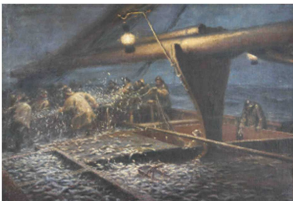
Francis Tattegrain, Pêche aux harengs, XIXe siècle