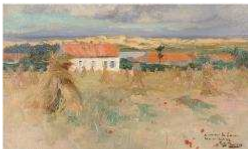
F. Thaulow, Camiers , 1892,

Collection particulière en dépôt au Musée du Touquet-Paris-Plage