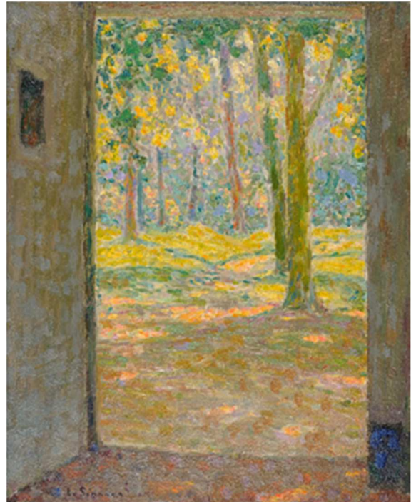
Henri Le Sidaner, Porte Ouverte , 1924

La confrontation entre les peintures anciennes et les créations contemporaines permettront de poser les bases de l'évolution artistiques au XXe siècle.